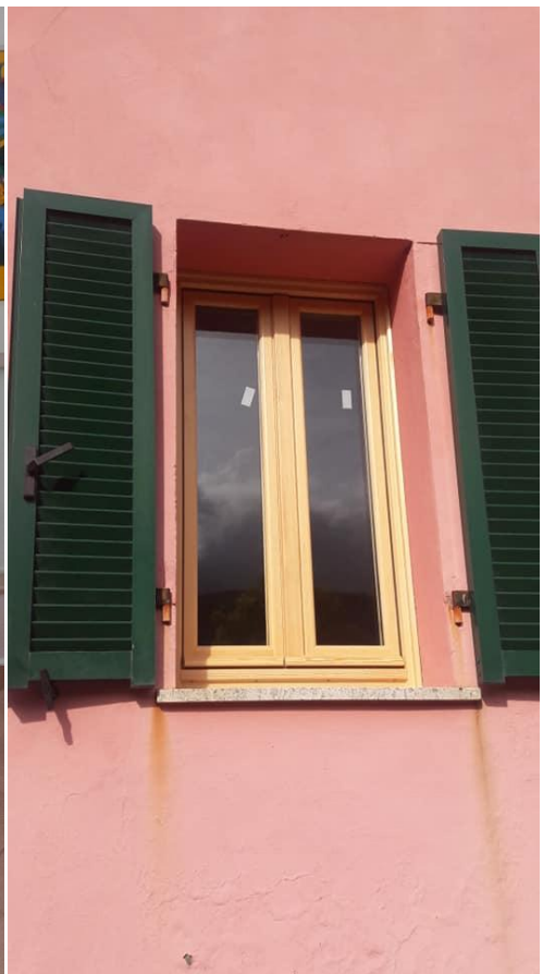
Nieuwe kozijnen met dubbel glas