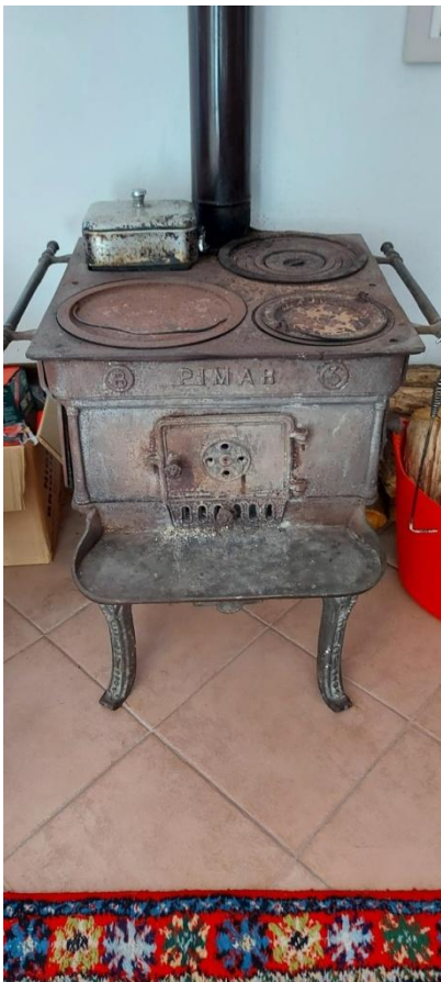
Oude antieke kachel

Veel is er in de afgelopen jaren gebeurd en we hebben diverse aanpassingen gedaan aan het huis. Zo zijn alle kozijnen vervangen door nieuwe kozijnen met dubbel glas; is er een nieuwe verwarmingsketel aangebracht en hebben we de antieke houtkachel vervangen door een nieuwe. De grootste aanpassing heeft plaatsgevonden in de voorste kelder, waar een nieuwe, mooie (en in de zomer vooral koele) slaapkamer en badkamer is gerealiseerd. De verschillende gasten die er inmiddels gelogeed hebben, zijn vol lof over de authentieke sfeer en comfort van deze ruimte.