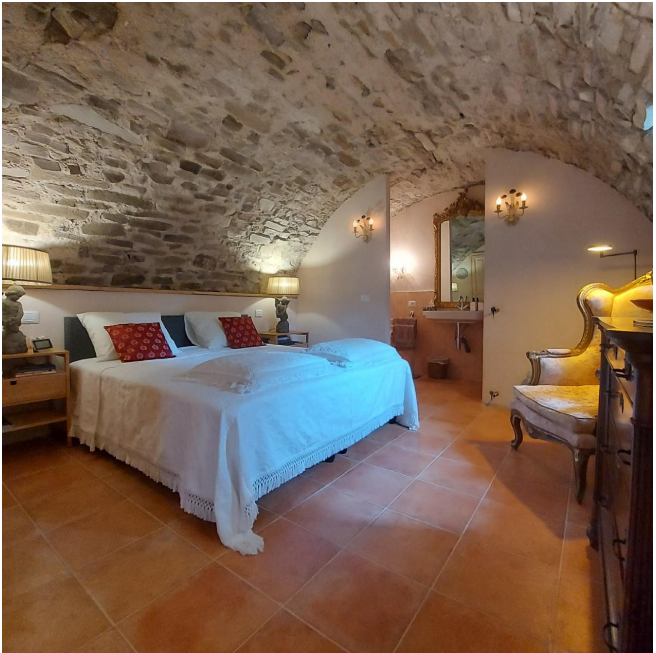
De verbouwde kelder