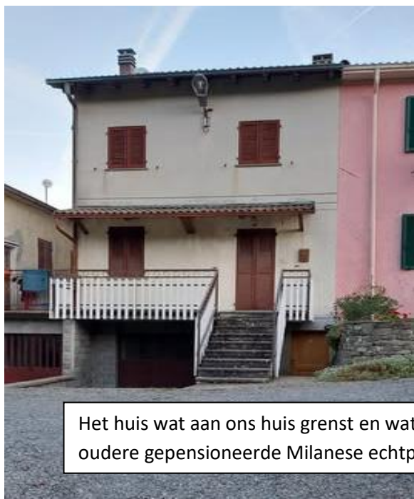
Het huis wat aan ons huis grenst en wat is verkocht aan het oudere gepensioneerde Milanese echtpaar als vakantiehuis.

In juli 2025 zijn de beide buurhuizen links naast ons huis verkocht. Het huis wat direct grenst aan ons huis is verkocht aan een oudere echtpaar uit Milaan en dient als vakantiehuis om de drukke stad te ontvluchten tijdens de zomermaanden. Het huis uiterst links van ons is verkocht aan een aardig engels echtpaar wat het huis heeft gekocht om vanaf september 2025 permanent te gaan bewonen. Ze hebben grootste plannen. Alles wordt opgeknapt en verbouwd en er moet een zwembad komen. Fijn dat er weer wat activiteit is en dat er zaken worden gerestaureerd en opgeknapt.