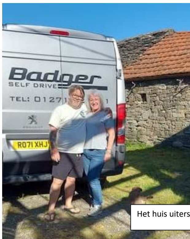
Het huis uiterst links en het Engelse echtpaar