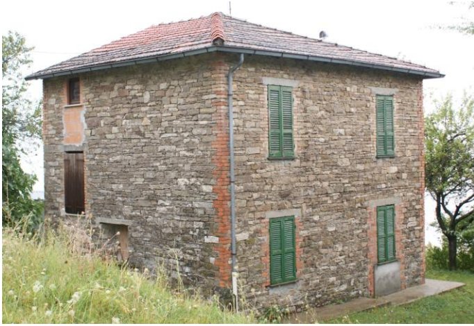
Casa Fagiolo in Bardi