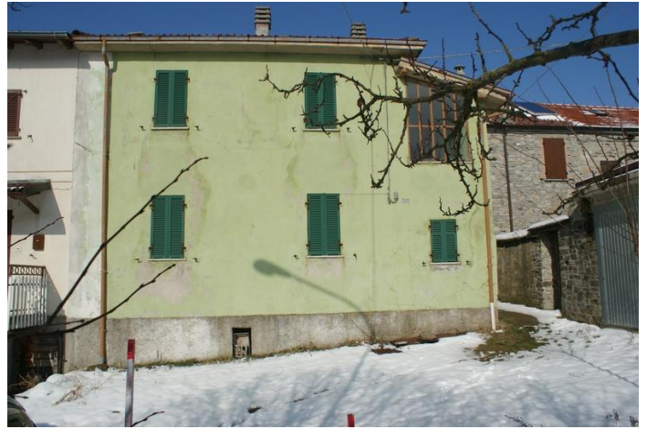
Casa del Porticato in Borgo val di Taro