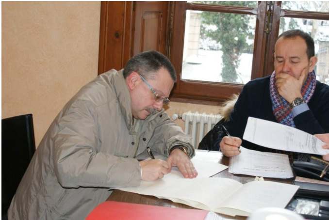
Het tekenen van de koopcontracten : de bankdirecteur tekent mee

Casa del Porticato, was met zijn 150 vierkante meter woonruimte, ruim bemeten, heeft 3 slaapkamers, 2 grote kelders, een enorme keuken en badkamer en niet al teveel grond, wat het onderhoud op afstand overzichtelijk zou moeten houden. Beneden waren de vloeren met steen betegeld en boven lag in de meeste kamers een parketvloer: de muren zaten strak in de stuc en de electra was herzien. De CV was deels aangelegd en er hing een "nieuwe" CV ketel, die inmiddels 10 jaar oud was maar ongebruikt. We maakten een ruwe schatting van de afbouw en verbouwkosten en kwamen op een 30.000- 40.000 extra investering uit en het huis zou dus net ons budget van 100.000 euro overschrijden. Na enige rondvraag bij de makelaar en onze adviseur, hebben we een bod gedaan van 55.000 euro wat binnen een dag met gretigheid werd geaccepteerd. We waren duidelijk op het juiste moment op de juiste plaats, een beetje geluk mag je hebben. De financiering is rondgekomen bij een plaatselijke bank, die ons een kleine hypotheekverstrekte voor 60% van de waarde tegen ongeveer 2% rente. Geregeld door onze makelaar, die bevriend is met de bankdirecteur. Ook zijn vriendschap met de burgemeester en andere notabelen, boden ons af en toe voordeel. Inclusief alle kosten, heeft het huis bij overdracht totaal 69.000 euro gekost en de verbouwing uiteindelijk zo'n 50.000 euro.