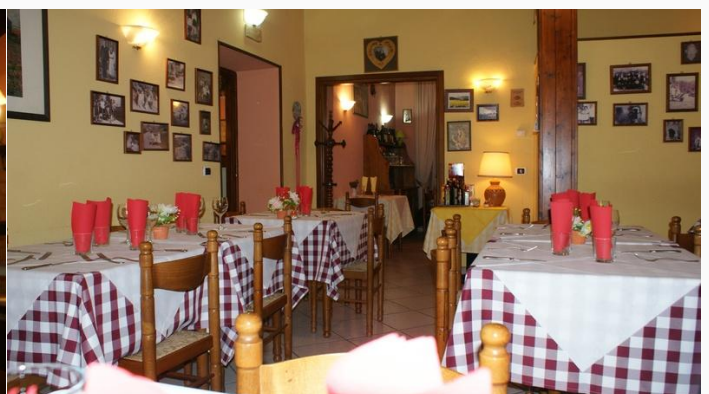
Pizzeria Mimosa, Baselica

De Valtaro en Valceno keuken is net zo eenvoudig, toegankelijk en puur als zijn oorspronkelijke bevolking. Slow food en gerechten van producten uit de streek voeren de boventoon. Seizoenen bepalen de gerechten. In het najaar worden overal paddenstoelen en kastanje-feesten en festivals georganiseerd. De gerechten met paddenstoelen, truffel en de toetjes (dolci) met kastanjes en wilde honing zijn tongstrelend. Überhaupt is de streek bekend om zijn vele creatieve desserts. In het voorjaar is het tijd voor de prugnoli, mini paddenstoeltjes met de smaak van truffel. In de omgeving wordt het hele jaar gejaagd, dus