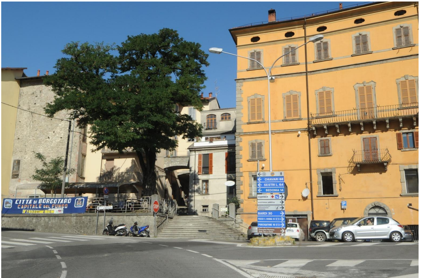
Borgo val di Taro of Borgotaro, provinciestadje in de Valtaro, hoofdstad van de paddenstoel (capitale del fungo)

Op onze rondgang en tochten werden we spoorlags verliefd op het vriendelijke bergachtige gebied. De Appenijnen zijn wat minder lieflijk dan het Toscaanse landschap, maar hebben toch een bepaalde vriendelijkheid en missen de ruigheid van de Alpen. Het is duidelijk een overgangsgebied tussen Alpen en de Toscaanse heuvels. Hoewel Emilia Romagna een van de rijkste gebieden van Italië is, waarschijnlijk, omdat de meeste van Italië's dure auto's hier gefabriceerd worden, zagen we al snel dat in dit gebied het grote geld niet verdiend werd. Eenvoudige landbouw en veeteelt, waar de koe en vooral het varken de spil van de economie vormen. Hardwerkende boerenmensen, zeker op wat oudere leeftijd getekend door het leven, maar opvallend vriendelijk en gastvrij en in hoge mate afhankelijk wat door de natuur wordt geboden. Landbouwgebied en boerderijen wisselen hier af met uitgestrekte bossen en natuurgebieden, doorkruist door rijk met forellen gevulde berggrivieren. We bevonden ons midden in het gebied waar de veelgeprezen prosciutto en coppa di Parma vandaan komt evenals de diverse andere fameuze Italiaanse salumi. Vanaf het begin merkten we dat de regionale keuken met zijn kenmerkende, simpele en pure gerechten, niet te versmaden bleek, zoals dat in veel Italiaanse gebieden trouwens het geval is.