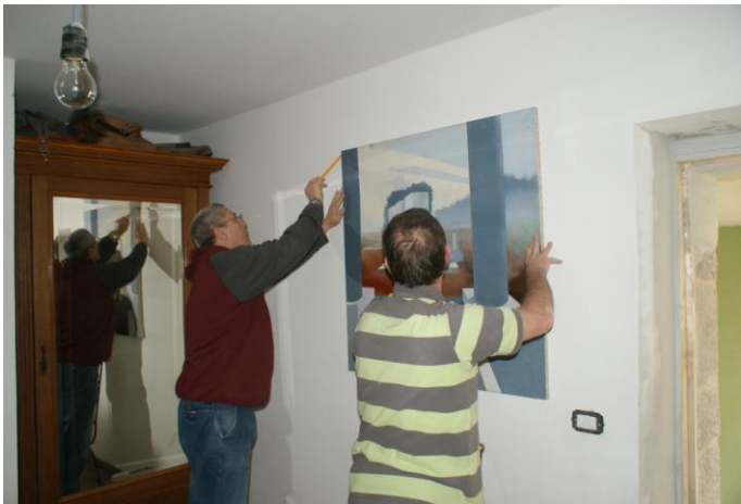
Er wordt hard gewerkt aan de inrichting ....