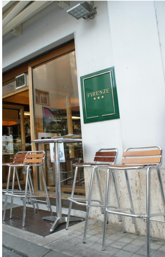
Hotel/ Bar Firenze in Borgo val di Taro