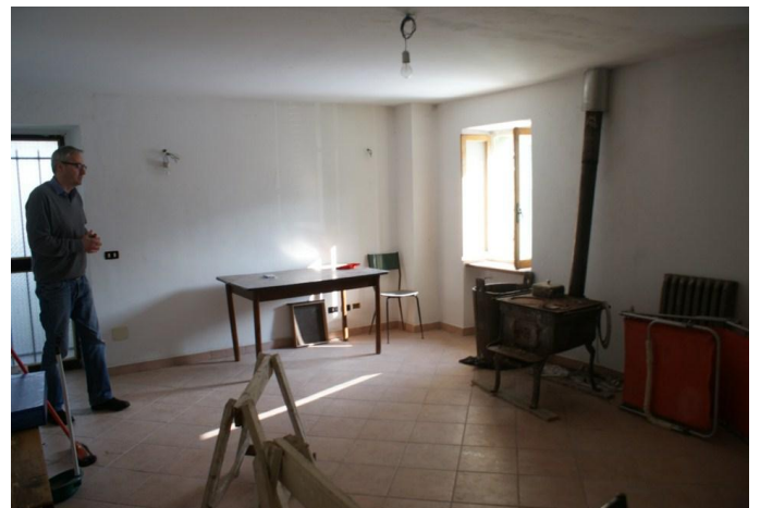
Woonkamer bij de eerste bezichting

Casa del Porticato, een naam die de makelaar het huis uit marketingoverwegingen had gegeven, vanwege de portiek en trappenhuis met veel glas, lag op 6 km van Borgo val di Taro, 15 minuten van de uitval-snelweg A15 van Parma naar La Spezia, op 400 meter hoogte, tegen de helling in het dal van de rivier de Taro, met uitzicht op de rivier. Ideaal en zoals gewenst, een aardig stadje bij de hand, centraal gelegen met allerlei toeristische attracties binnen een rijafstand van 1- 2 uur en geschikt dus voor dagtrips en uitstapjes. Parma, wat een erg leuke stad blijkt te zijn, op 40 minuten rijden, de kust op een klein uur afstand, vlakbij de prachtige Cinqueterre, Pisa en Toscane. Bologna op anderhalf uur. Veel mooie plaatsjes, zoals Pontremoli, Salsomaggiore en Varese Ligure in de buurt, veel bezienswaardige kastelen en niet op de laatste plaats de vele restaurantjes waar je heerlijk kunt