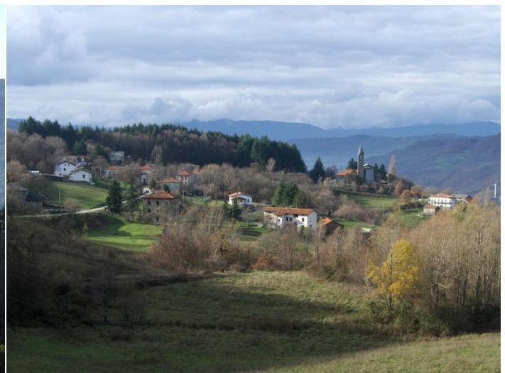
Baselica 5 km van Casa del Porticato