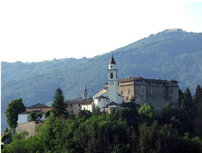
Compiano: kerk en kasteel