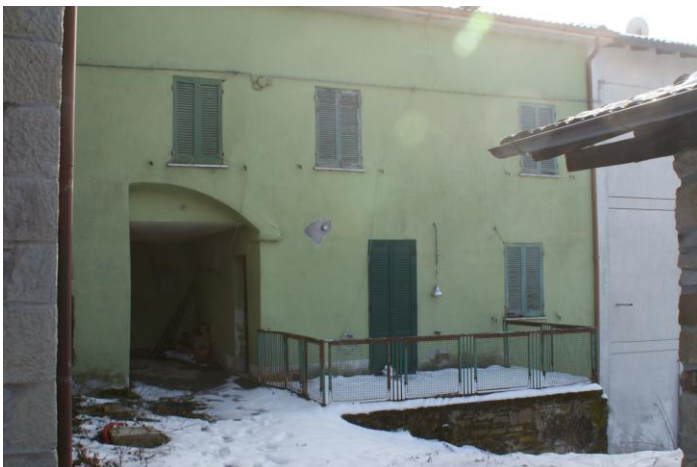
Achterkant Casa del Porticato, winter 2010-2011