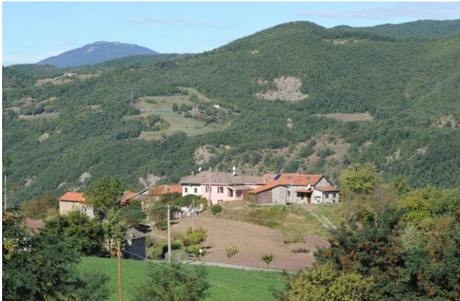
De ligging van Casa del Porticato