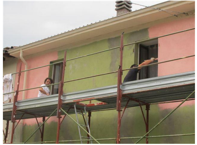
Het huis wordt Ligurisch roze geschilderd