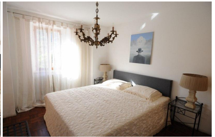
Een van de 3 slaapkamers