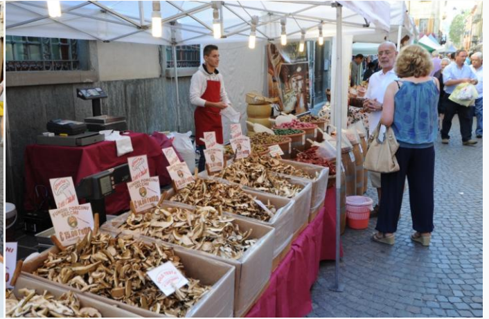
Enorme Mortadella's op het jaarlijkse slow food festival in Borgotaro Funghi

Onze Italiaanse buurtgenoten van de Valtaro zijn trots op de producten, die ze zelf produceren en zo zijn er het hele jaar door festiviteiten, die gebaseerd zijn op de producten uit de omgeving. Feesten en festivals zijn er in overvloed. 's Zomers worden er in Borgotaro wekelijks meerdere muzikfestivals, zoals jazz, drumbands, koren, opera etc. georganiseerd.