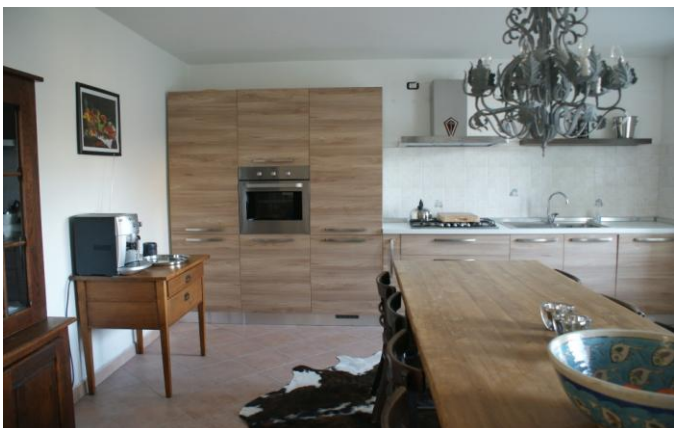
De keuken, met grote een 8-persoons eettafel