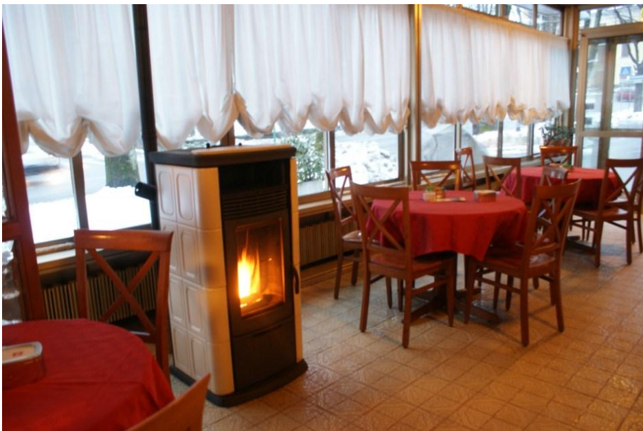
Eetzaal Hotel Firenze

De inkomsten van deze nering werden overduidelijk en voornamelijk gegeneerd door het populaire typisch Italiaanse en levendige barretje van het hotel, waar de hele dag door, de plaatselijke bevolking in en uitloopt voor een overheerlijke espresso of