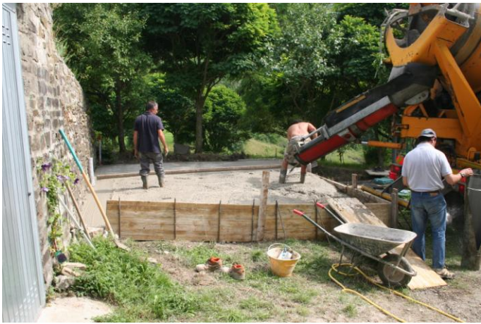
De aanleg van het zonneterras