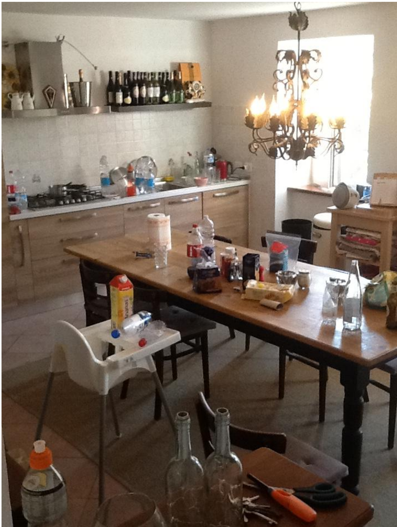
Een zootje in de keuken: ik zou me schamen om het zo achter te laten; respectloos!.